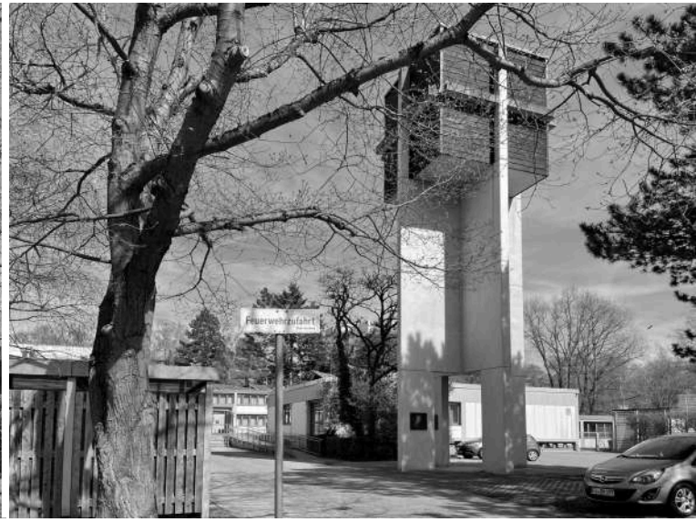
Kath. Kirche Menschwerdung Christi, Architekt Werner Wirsing, Anfang 1970