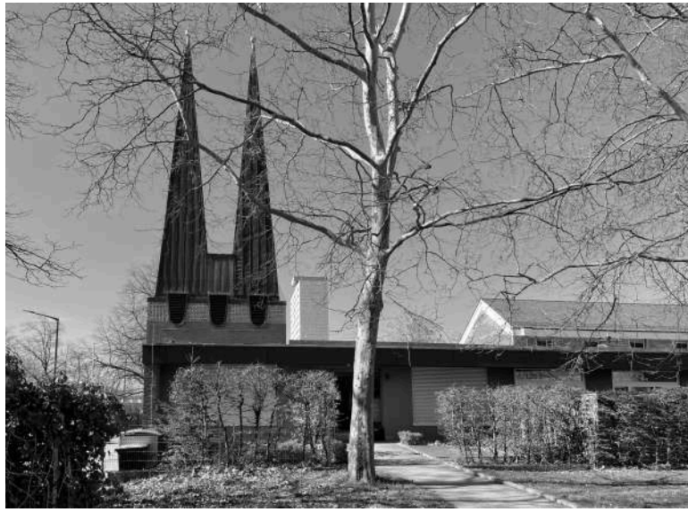
Evang-Luth.Paul-Gerhardt-Kirche, Architekt Franz Reichel, Einweihung 1961