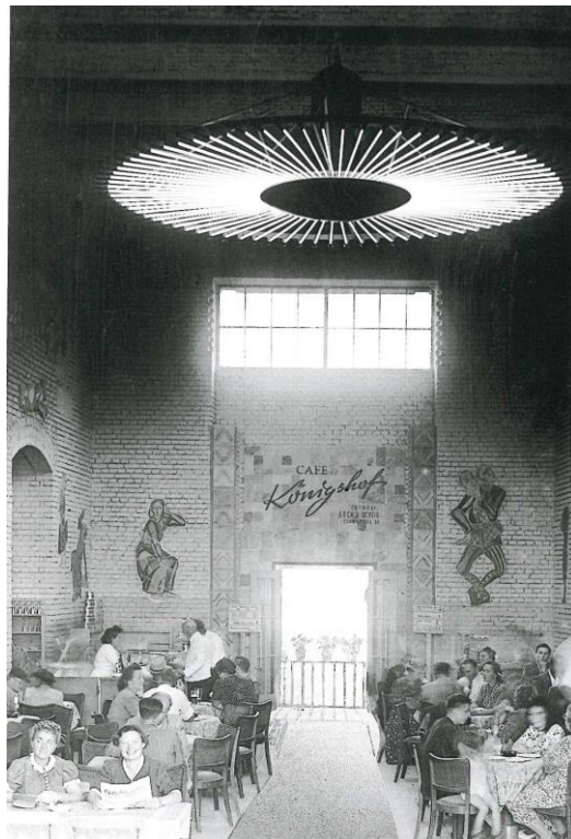
„Café Königshof“ in der Kongresshalle zur Deutsche Bauausstellung 1949

1948 gaben die Amerikaner die Liegenschaft der Stadt zurück. Damit begannen Versuche einer Nutzung. 1949 fand die erste Deutsche Bauausstellung dort statt. Sie sollte einem breiten Publikum Perspektiven des Wiederaufbaus, der Bauwirtschaft und der Stadtplanung aufzeigen, z.B. beim Räumen von Trümmern oder dem Errichten von Wohnungen. Nach dem großen Erfolg mit über 300.000 Besucherinnen und Besuchern nutzte die Stadt Nürnberg die Halle 1950 für die Jubiläumssausstellung „900 Jahre Nürnberg“.